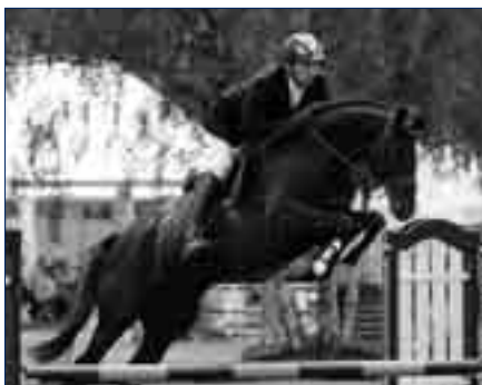
Das Springgenie Hirtentanz trägt die väterliche Linie bereits in die 5. Generation.

Das positive Körurteil des schwarzen Athleten war seinerzeit umstritten, man kritisierte seine mangelnde Korrektheit im Vorderbein, seinen etwas herben Typ und – wie sich die Zeiten ändern – eine augenfällige Schulterfreiheit, die im Trakehner Hengstbuch, wie auch bei seinem Vater Burnus kritisch als „etwas hohe Aktion“ beschrieben wird. Doch Habicht hatte in Dr. Schilke einen einflussreichen Verfechter, er verwies auf seine gleichermaßen wertvolle und bewährte Abstammung, auf den energischen Habitus und die kraftvolle Darstellung des jungen Hengstes und stellte ihn nach Rantzau,