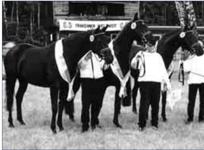
Dekade, Donaukaiserin und Donaугlück, alle vom Klosterhof, von Hohenstein, die Siegerfamilie 2002.

Auch das Jahr 1984 bot eine Landesschau mit viel Prominenz: