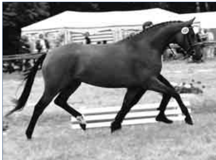
Bewegungsoptimal präsentiert sich Perkallen, die 1. Reservesiegerin im Jahre 2002.

Nahezu alle Dreijährigen hatten auch am Folgetag der Landesschau in ihrer Klasse ein gewichtiges Wort mitzureden. Der Siegerstute vom Vortag war auch hier die Siegeschleife nicht zu neh-