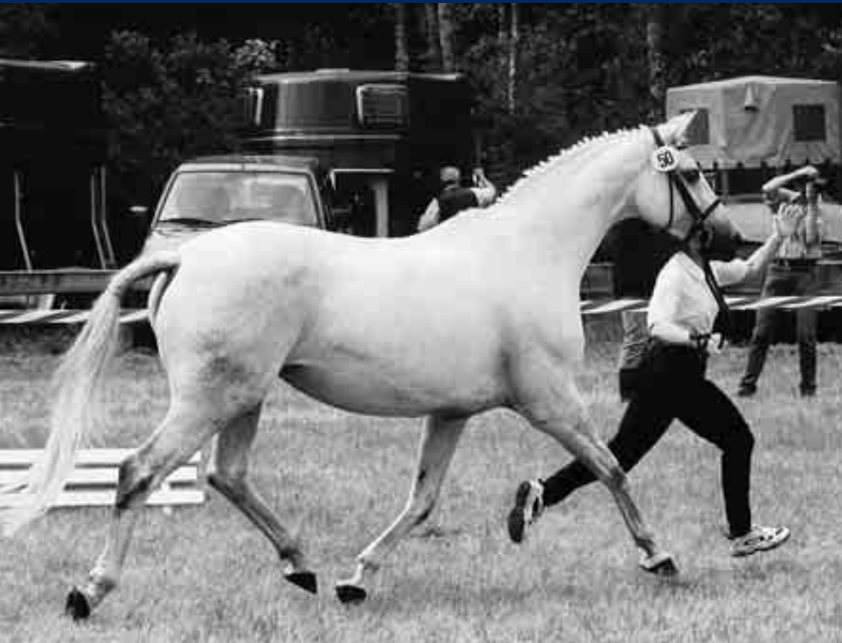
Coppelia war eine eindrucksvolle Siegerstute im Jahre 2002.