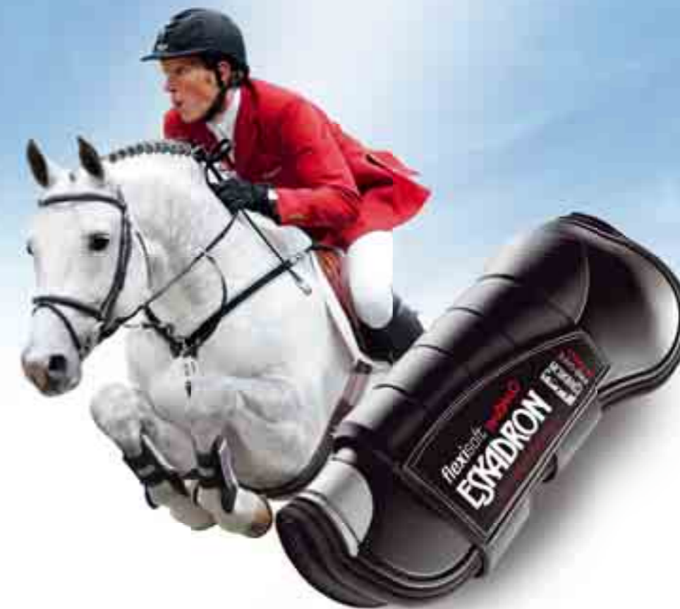
Fachhandelsadressen über Eskadron, 33819 Werther · Postfach 1130 · www.eskadron.de

Qualität ist kein Luxus ESKADRON Quality is no Luxury