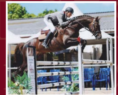
PHLOX (TRAK.) Waitaki - Unesco - Persaldo

Landgestüt Zweibrücken GmbH | Gutenbergstraße 16 66482 Zweibrücken | Besamungsstation Tel.: (0 63 32) 90 30 88