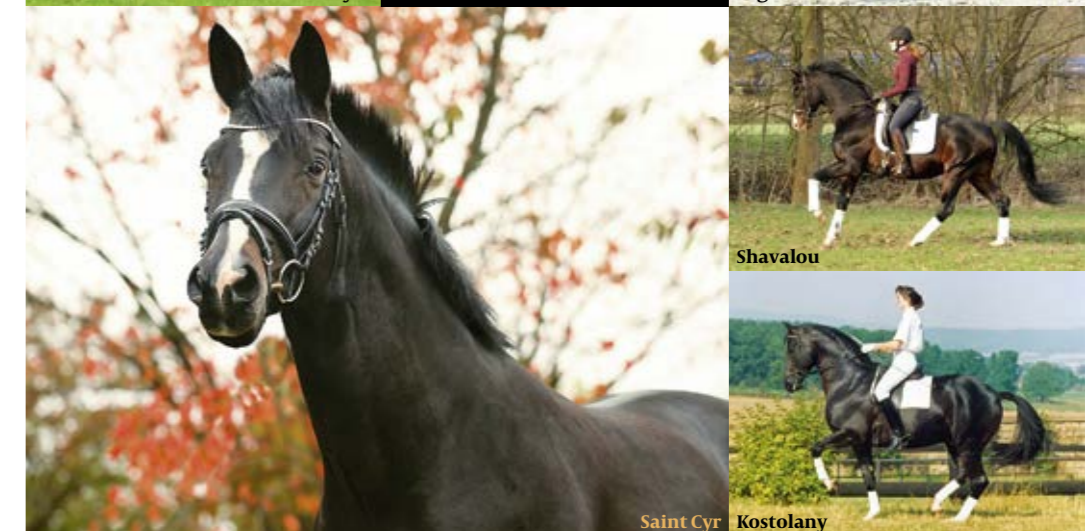
Saint Cyr, Kostolany