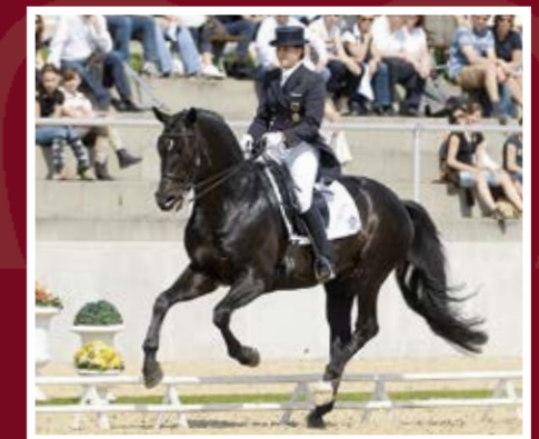
INSTERBURG TSF (TRAK.) Hohenstein - Giorgio Armani - Leonardo