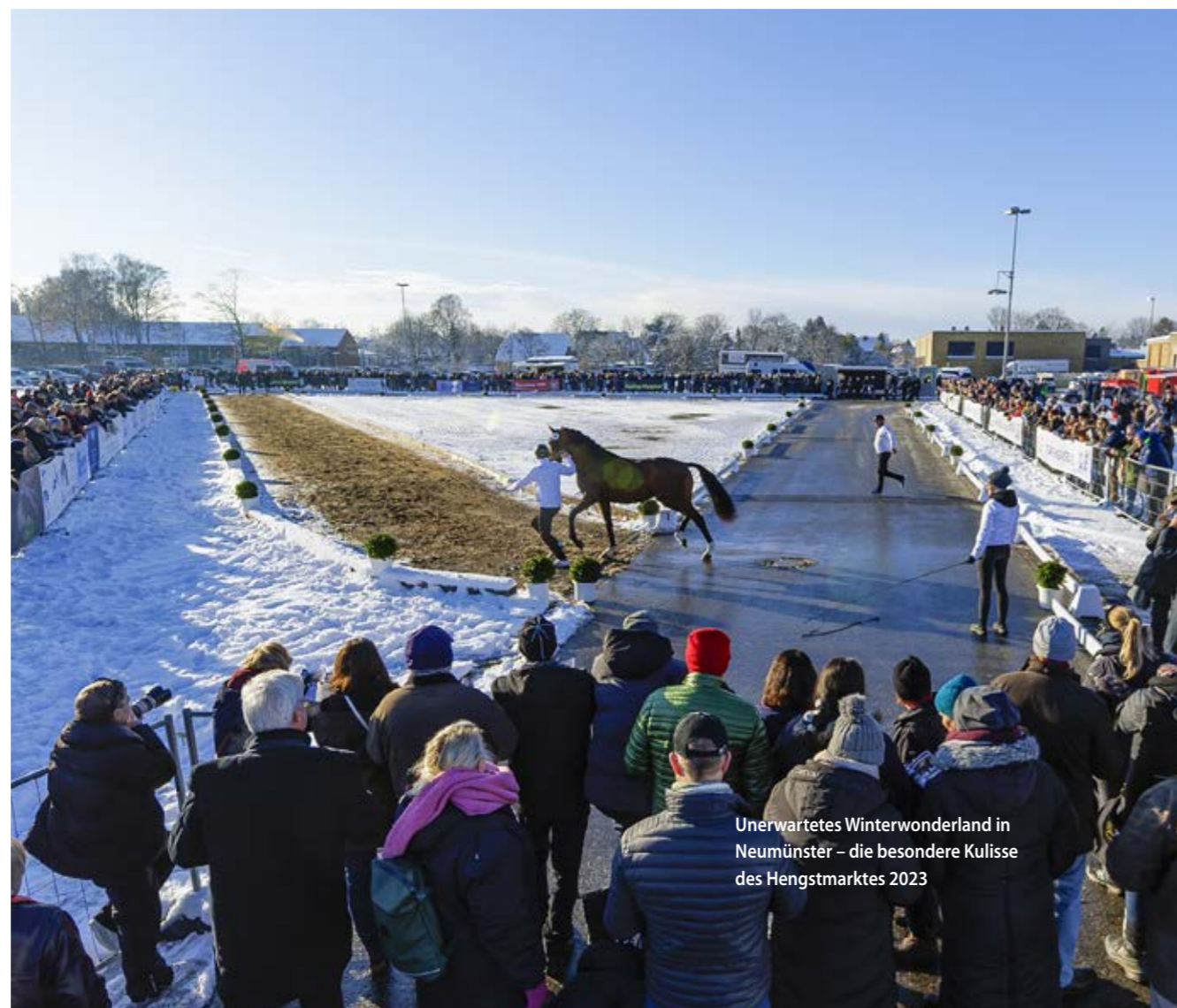
Unerwartetes Winterwonderland in Neumünster – die besondere Kulisse des Hengstmarktes 2023

DER 62. TRAKEHNER HENGSTMARKT WIRD EINZIGARTIG, EMOTIONAL UND INNOVATIV. VON MITTWOCH, DEN 27. NOVEMBER BIS SONNTAG, DEN 1. DEZEMBER STEHEN DIE HOLSTENHALLEN ZU NEUMÜNSTER GANZ IM ZEICHEN DER ÄLTESTEN UND EDELSTEN REITPFERDERASSE.