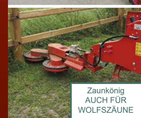
Zaunkönig AUCH FÜR WOLFSZÄUNE

Jetzt bestellen! Tel. +49 2593/95 20 95-0 www.kneilmann-geraetebau.de