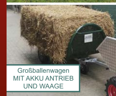
Großballenwagen MIT AKKU ANTRIEB UND WAAGE